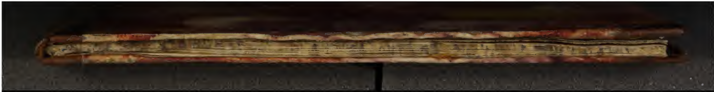
Early European Books, Copyright © 2009 ProQuest LLC. Images reproduced by courtesy of the Royal Library, Copenhagen. Hielmst. 193 4° (LN 1475 4° copy 2)